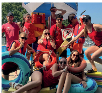
Normand Grenier Maire

En terminant, je profite de l'occasion pour remercier notre personnel étudiant qui a travaillé pour le bien-être de chacun durant cet été chaud, que ce soit au camp de jour pour animer les jeunes citoyens, à la piscine municipale pour du plaisir assuré en toute sécurité ou aux travaux publics pour des parcs et espaces verts de toute beauté!